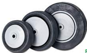
PS100RU / PS125RU / PS150RU