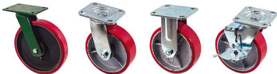
319460 / HC62PRG / HC62PRF / HC62PRGF